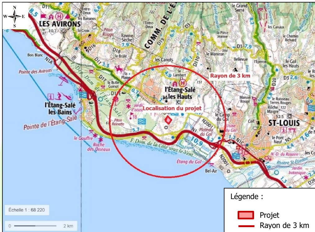
Figure 3 : Localisation du projet et du rayon d’affichage

La cartographie suivante donne la localisation du rayon d’affichage.